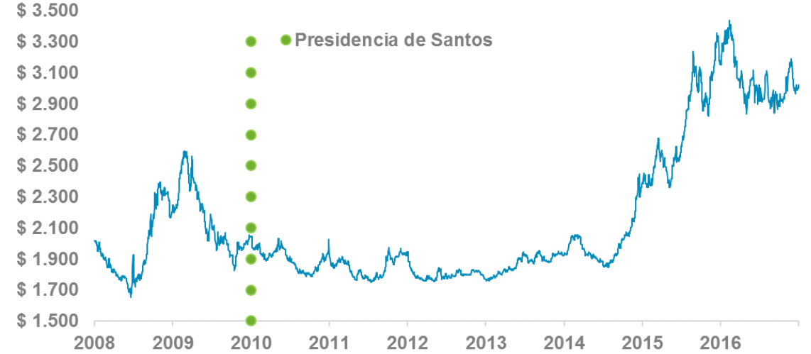
Tasa de cambio (COP/USD)