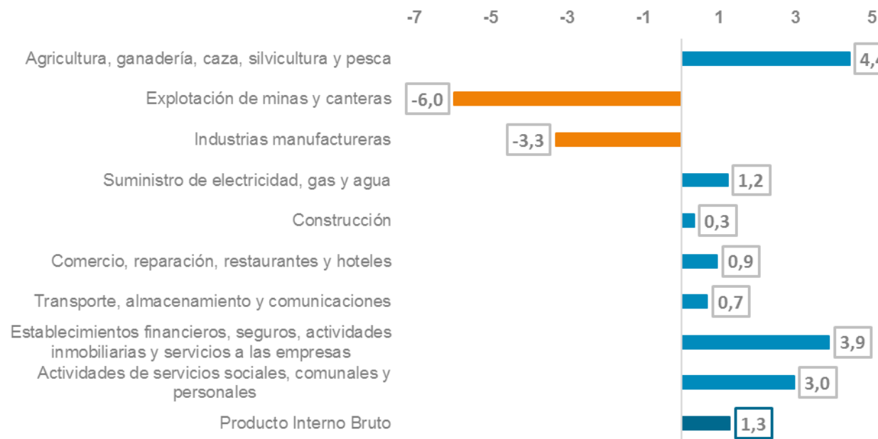
PIB segundo trimestre 2017* por componentes de oferta (Variación anual, %)